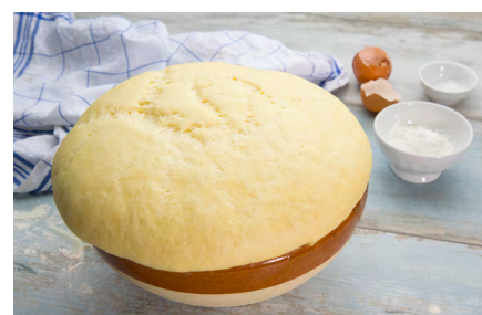
Der aufgegangene Hefeteig