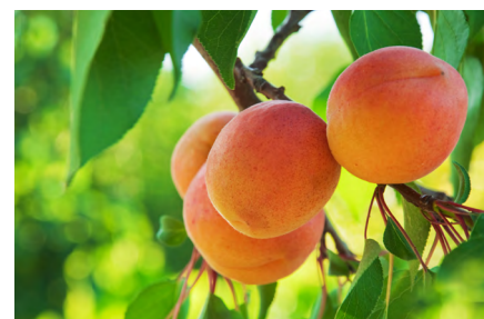
© BVE0 / Süße Schwester der Zwetschge