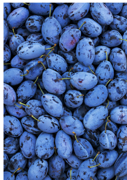
Zwetschgen nach der Ernte

Alle Rezepte zum downloaden: www.deutsches-obst-und-gemuese.de/rezepte/