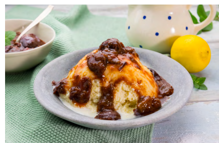
Dampfnudeln mit Pflaumen