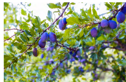
Reife Zwetschgen an Zweigen

Beim Einkauf sollte man darauf achten, dass die Pflaumen und Zwetschgen nicht zu fest sind. Denn sie gehören zu den klimakterischen Früchten