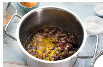
© Ariane Bille für BVE0 /Pflaumensauce