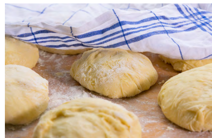
© Ariane Bille für BVEO / Dampfnudeln nach dem Ruhen

Bitte beachten Sie: Veröffentlichung nur mit Quellennachweis „BVEO“ oder „Pressebüro Deutsches Obst und Gemüse“ an Bild und Text. Die angehängten Daten dürfen nur für Zwecke der Information über Obst und Gemüse verwendet werden. Eine Weitergabe an Dritte sowie die Veränderung des Datenmaterials ist nicht gestattet. Eine erneute Verwendung zu einem anderen Zeitpunkt oder Zweck bedarf einer erneuten Genehmigung durch das Pressebüro Obst und Gemüse. Wir freuen uns über ein Belegexemplar oder eine kurze E-Mail, wenn Sie unser Material nutzen.