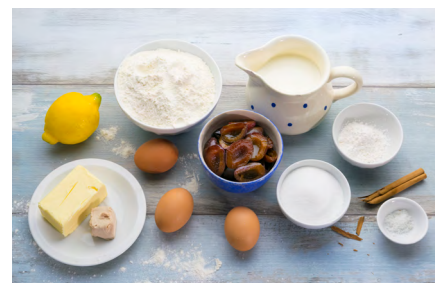
Zutaten für Dampfnudeln mit Pflaumensauce