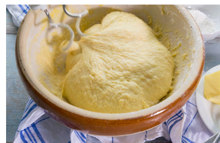
© Ariane Bille für BVE0 /Hefeteig