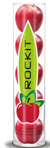
Rockit-Tube ® BVE0

„Unsere Erzeugerbetriebe haben jahrzehntelange Erfahrungen im Apfelanbau, mit besonderem Augenmerk auf qualitativ und geschmacklich gute Sorten, wie den traditionell äußerst beliebten Elstar, Gala oder Braeburn. Und am „Tag des Deutschen Apfels“ treten wir dann jedes Jahr wieder den Beweis an, dass die nicht sofort verkauften Äpfel, dank ausgefeilter Lagertechnologie noch immer ebenso knackig, frisch und aromatisch schmecken, wie Äpfel die direkt vom Baum kommen. Den zahlreichen Apfel-Fans stehen dadurch auch jetzt im Januar knackig-leckere, heimische Äpfel zur Verfügung. In einer Jahreszeit, in der es nur ein sehr begrenztes Angebot an anderem Obst und Gemüse aus hiesigem Anbau gibt, ist das etwas Besonderes.“