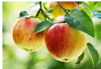
Äpfel am Baum

*Agrarmarkt Informations-Gesellschaft mbH (AMI)/Statistisches Bundesamt 2017