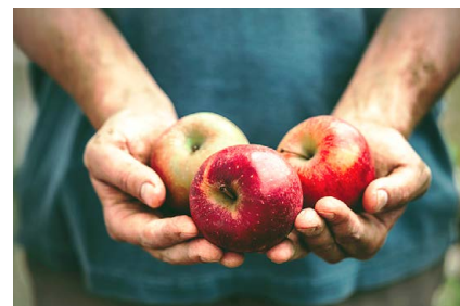
Knackige, saftige Äpfel

Alle Bahnfahrer und Bahnhofsbesucher sind herzlich eingeladen kräftig in die Pedale zu treten. Denn der Mixer wird allein durch Beinarbeit angetrieben. Neben „knack“-tastischem Spaß winkt als Belohnung ein köstliches Geschmackserlebnis: der selbst erstrampelte fruchtig-frische Apfel-Smoothie! Weniger sportbegeisterte Menschen dürfen sich ebenfalls erfrischen, über die Vorzüge in Deutschland produzierter Äpfel informieren, am Gewinnspiel teilnehmen und sich über gesunden Reiseproviant – die „Rockit-Tube“ – freuen!