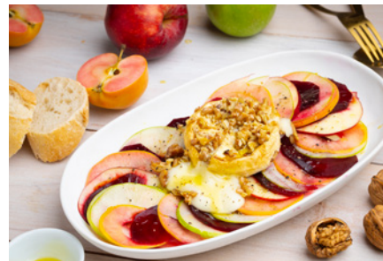
Apfel-Carpaccio mit Rote Bete und Walnuss-Crunch

Wer nun daran denkt, sein Kompendium an Apfelrezepten zu erweitern, dem stehen eine riesige Menge von Inspirationsquellen zur Verfügung. Allein auf der Website von „Deutschland – Mein Garten.“ finden sich 79 köstliche Rezepte rund um das deutsche Lieblingsobst. Angefangen bei einem köstlichen Apfeleis am Stiel , über eine exquisite Apfelruchttorte mit Schokolade und Chili , raffiniertes Apfel-Rote-Bete Carpaccio oder frisches Apfel-Lachs-Tartar , bis hin zu einem Flammkuchen mit Apfel, Speck und Honig oder einem Apfel-Möhren-Porridge für einen leckeren Start in den Tag. Der apfeligen Vielfalt sind in deutschen Küchen keine Grenzen gesetzt!