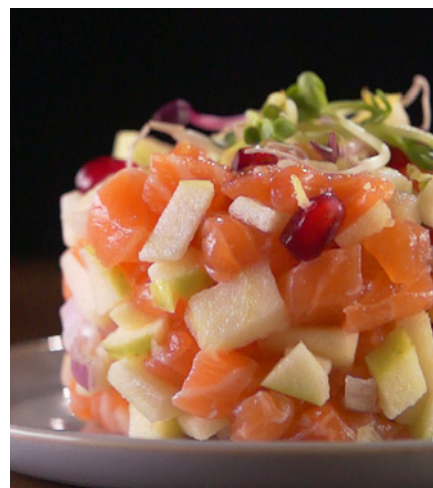
© Simon Ruschmeyer für BVE0 Apfel-Lachs-Tatar